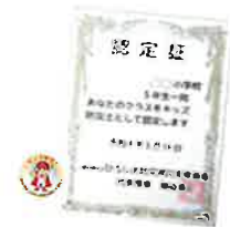
キッズ防災士の認定証と認定バッジがもらえる!